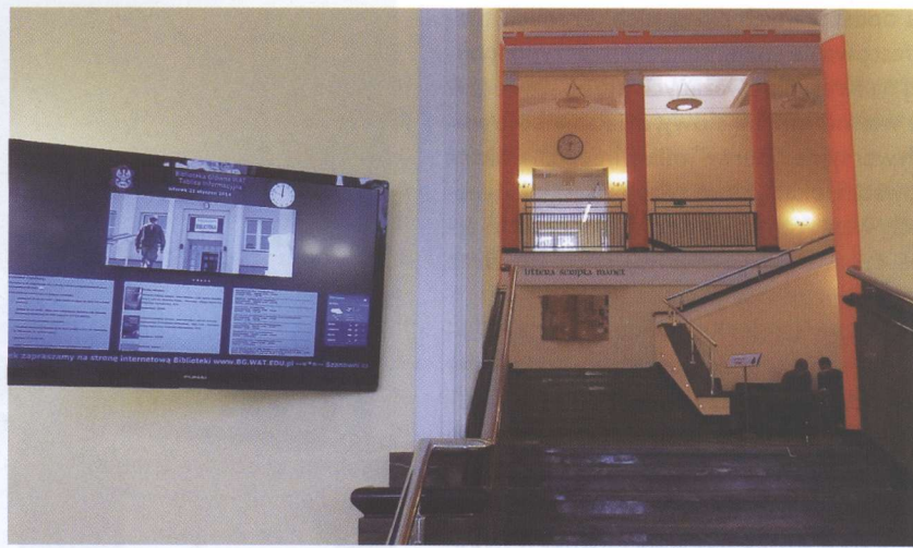
Zainstalowany przy wejściu głównym ekran ułatwia dostęp do informacji